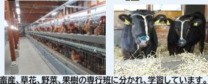
畜産、草花、野菜、果樹の専行班に分かれ、学習しています。